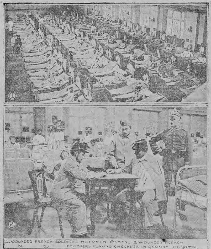
1. WOUNDED FRENCH SOLDIERS IN GERMAN HOSPITAL. 2. WOUNDED FRENCH PRISONERS PLAYING CHECKERS IN GERMAN HOSPITAL.

El grabado superior es una vista general de uno de los salones de un hospital alemán, en donde se atiende a los prisioneros heridos de los ejércitos aliados. El grabado inferior muestra a dos de estos heridos, que juegan al tablero en el mismo hospital. Estos heridos están bajo el cuidado de un cirujano militar francés, que también cayó prisionero y que se ve a la izquierda del grabado.