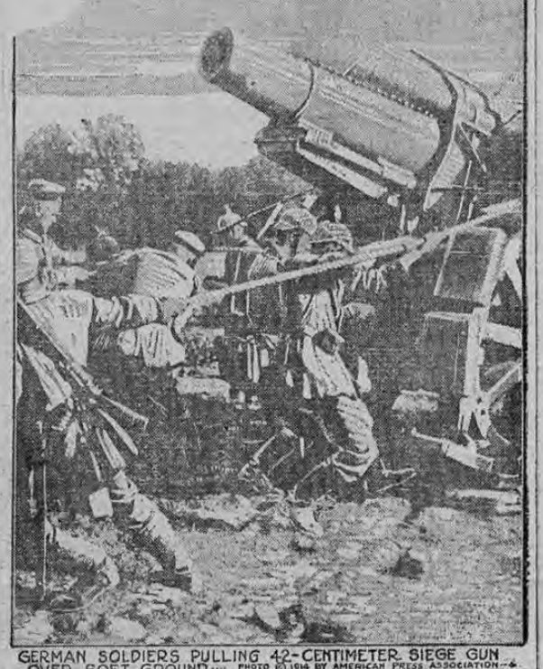
GERMAN SOLDIERS PULLING 42-CENTIMETER SIEGE GUN OVER SOFT GROUND.

Lado práctico de la lucha alemana, en que los soldados tiran de una cuerda como en un concurso de lucha naval